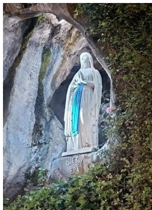
MARIA SANTISSIMA IMMACOLATA GROTTA DELL'APPARIZIONE LUORDES (FRANCIA)