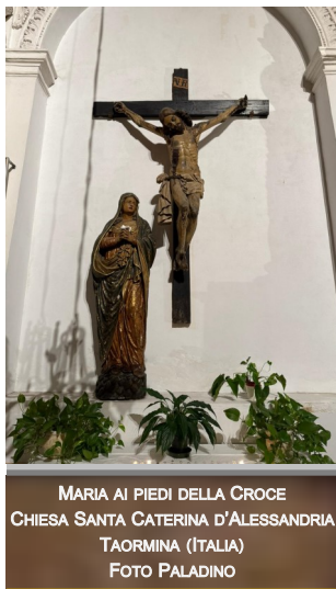
MARIA AI PIEDI DELLA CROCE CHIESA SANTA CATERINA D'ALESSANDRIA TAORMINA (ITALIA)