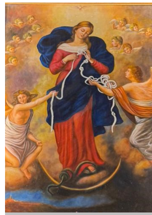
MADONNA CHE SCIOLGIE I NODI CHIESA PIETA' DEI TURCHINI NAPOLI (ITALIA)