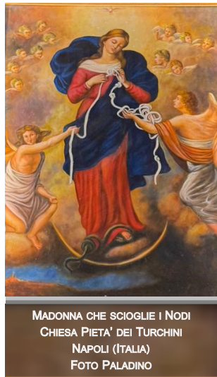
MADONNA CHE SCIOGLIE I NODI CHIESA PIETA' DEI TURCHINI NAPOLI (ITALIA)