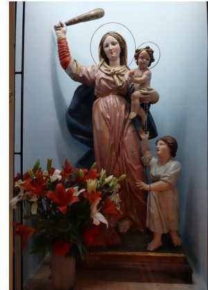
MADONNA DEL SOCCORSO SANTUARIO OMONIMO LAMEZIA TERME (ITALIA)