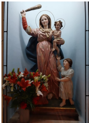
MADONNA DEL SOCCORSO SANTUARIO OMONIMO LAMEZIA TERME (ITALIA)