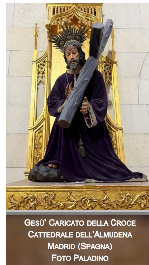
GESU' CARICATO DELLA CROCE CATTEDRALE DELL'ALMUDENA MADRID (SPAGNA)