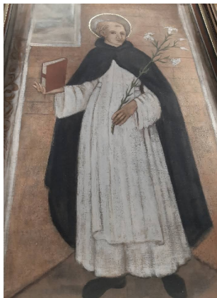
SAN DOMENICO SANTUARIO OMONIMO SORIANO CALABRO (VIBO VALENTIA)